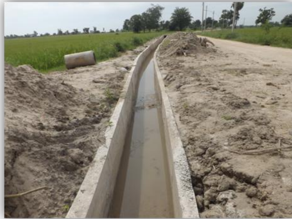
32. โครงการก่อสร้างรางระบายน้ำ คสล. รูปตัวยู หมู่ที่ 5 บ้านเหนือ